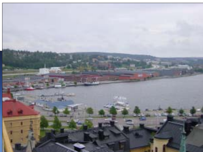
Sundsvalls hamn