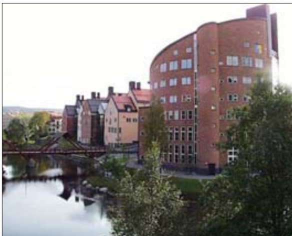
Campus Åkroken, Mittuniversitetet