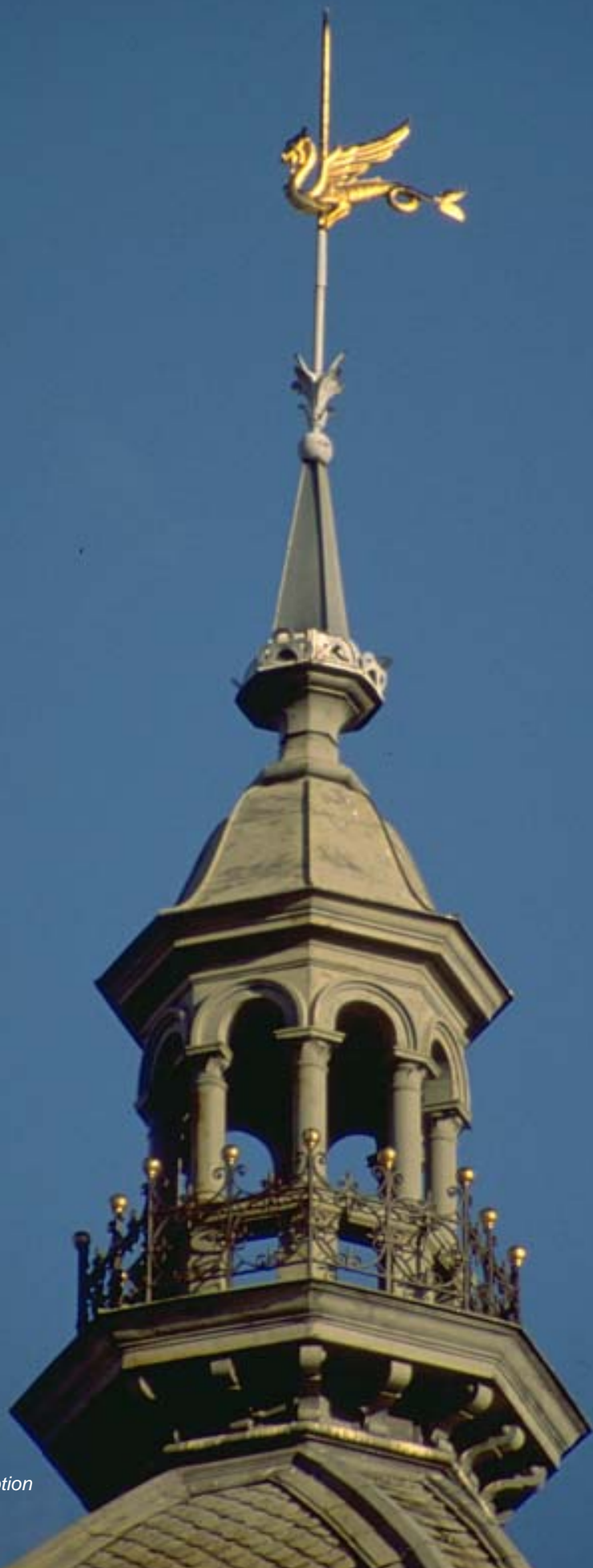
Hirschka husets drake